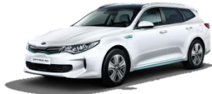
Snow White Pearl (SWP) perłowy