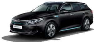
Aurora Black (ABP) perłowy