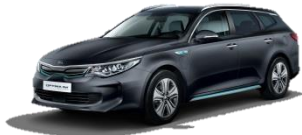
Platinum Graphite (ABT) metalik