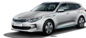
Silky Silver (4SS) metalik