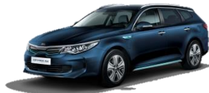
Gravity Blue (B4U) metalik