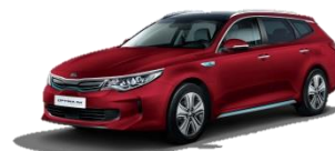
Temptation Red (K3R) metalik