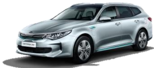
Aluminium Silver (C3S) metalik